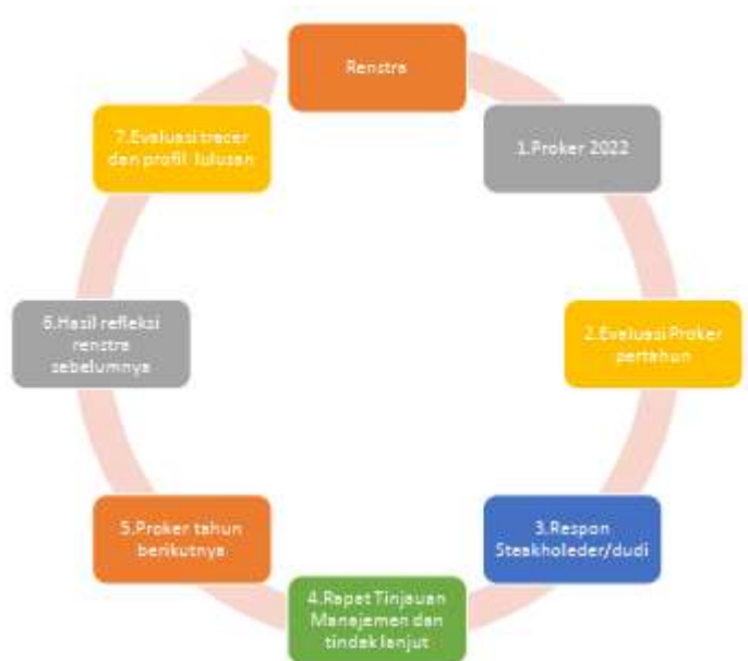
Gambar 1.2 Alur Pengembangan Renstra FMIPA

rencana strategis, tata kelola, evaluasi profil lulusan program studi (prodi), dan restrukturisasi kurikulum prodi. Pengembangan renstra FMIPA UNESA untuk tahun 2021-2025 seperti disajikan pada Gambar 1.2 .